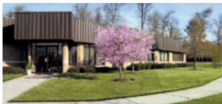
KNF Neuberger, Inc., США