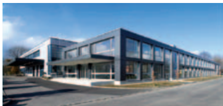
KNF Flodos AG, Швейцария