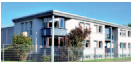
KNF Neuberger SAS, Франция