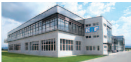
KNF Micro AG, Швейцария