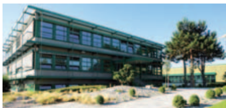
KNF Neuberger GmbH, Германия